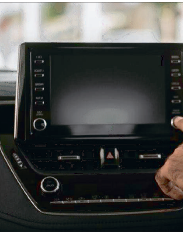
खरोंच हटाने में उपयोगी हो सकता है। पर्याप्त मात्रा में बेकिंग पाउडर के साथ थोड़ी मात्रा में पानी मिलाएं। इसे तब तक मिलाएं जब तक यह पेस्ट न बन जाए। एक मुलायम कपड़ा लें और उसे पेस्ट में डुबोएं और फिर कपड़े को धीरे-धीरे घुमाते हुए स्क्रीन पर रगड़ें।

टूथपेस्ट कार की टचस्क्रीन से खरोंच हटाने में उपयोगी हो सकती है। एक मुलायम कपड़ा या रुई लें और इसे थोड़ी मात्रा में टूथपेस्ट में डुबोएं। वाहन की स्क्रीन पर कपड़े या रुई के टुकड़े को धीरे-धीरे रगड़ें। इसके बाद टूथपेस्ट को हटाने के लिए स्क्रीन को मुलायम सूखे कपड़े से साफ करें। इसके अलावा भी स्क्रैच हटाने के कई विकल्प मौजूद हैं।