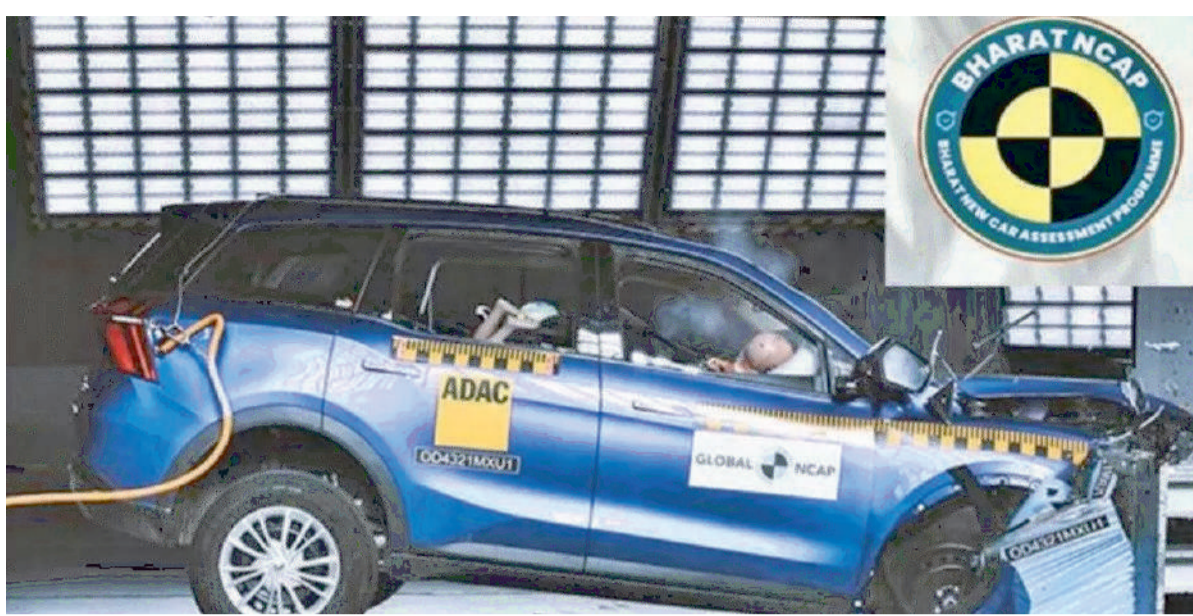
उम्मीद कर सकते हैं कि क्रेटा भी बेहतर सुरक्षा और सुरक्षा प्रदान करेगी। Hyundai Tucson Hyundai Tucson को लैटिन एनकेप टेस्ट हो चुका है, जबकि भारत में निर्मित मॉडल का अभी तक कोई कैंडा परीक्षण नहीं हुआ है। वैश्विक मॉडल को वयस्क सुरक्षा में 3-स्टार रेटिंग दी गई है। देखना ये होता है कि Bharat NCAP में ये कैसा परफॉर्मेंस करने वाली है।

लिया है तो इस आर्टिकल में हम आपको सेफ्टी फीचर्स बताने वाले हैं। नई दिल्ली | BNCA कैंडा टेस्ट में सबसे पहले Tata Safari और Harrier SUV ने 5-स्टार हासिल किए हैं। अब टेस्टिंग एजेंसी की ओर से दूसरे दौर के मूल्यांकन के लिए 3 Maruti और 3 हुंडई मॉडल सहित 6 कारों का कैंडा टेस्ट करने के लिए तैयार है। आइए, इन कारों के बारे में जान लेते हैं। Maruti की ये फ्लैगशिप एसयूवी ग्लोबल-सी प्लेटफॉर्म पर निर्मित है। सेफ्टी फीचर्स की बात करें, तो ये डुअल फ्रंट एयर बैग, ईबीडी के साथ एबीएस, इंस्पपी, हिल होल्ड असिस्ट, सीट बेल्ट प्री-टेंशनर और फोर्स लिमिटर और आईएसओफिक्स माउंट के साथ आती है। इसके अलावा ये 6 एयर बैग, 360-डिग्री कैमरा और हेड-अप डिस्प्ले के साथ आती है। Maruti Suzuki Brezza Maruti की सबसे पॉपुलर एसयूवी Brezza, भारत में कैंडा टेस्ट से गुजरने वाली अगली कार है। ग्लोबल-सी प्लेटफॉर्म पर निर्मित, 2024 Maruti Brezza में डुअल-फ्रंट एयर बैग, ईबीडी के साथ एबीएस, इंस्पपी, हिल होल्ड असिस्ट, फोर्स लिमिटर के साथ सीट बेल्ट प्री-टेंशनर और ISOFIX चाइल्ड सीट रेस्ट्रिक्ट सिस्टम मानक के रूप में उपलब्ध है। Maruti Suzuki Baleno सुजुकी के HEARTACT प्लेटफॉर्म पर निर्मित, 2024 Maruti Baleno में डुअल फ्रंट एयर बैग, ईबीडी के साथ एबीएस, हिल होल्ड असिस्ट के साथ इंस्पपी, सभी यात्रियों के लिए 3-पॉइंट सीट बेल्ट, फोर्स लिमिटर के साथ सीट बेल्ट प्री-टेंशनर और