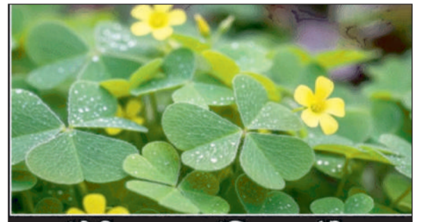
चांगेरी घास - 'इंडियन सॉरल' आयुर्वेद की महत्वपूर्ण औषधि - सेहत का खजाना

ये तत्व शरीर को डिटॉक्स करने, रोग प्रतिरोधक क्षमता बढ़ाने और कोशिकाओं को क्षति से बचाने में सहायक होते हैं। * चांगेरी घास के औषधीय