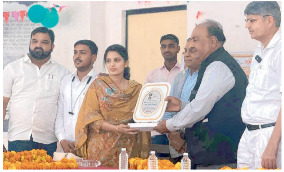
परिवहन विशेष न्यूज