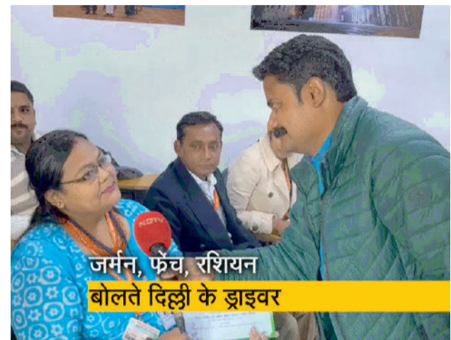
जर्मन, फ्रेंच, रशियन बोलते दिल्ली के ड्राइवर